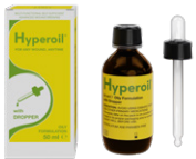
Flacon de 50 ml en verre Formulation Huileuse (avec compte-gouttes)