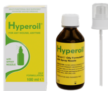
Flacon en verre de 100 ml Formulation Huileuse (avec vaporisateur)