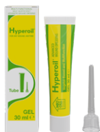
Tube de 30 ml Formulation en Gel (avec applicateur)