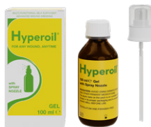
Flacon en verre de 100 ml Formulation en Gel (avec vaporisateur)